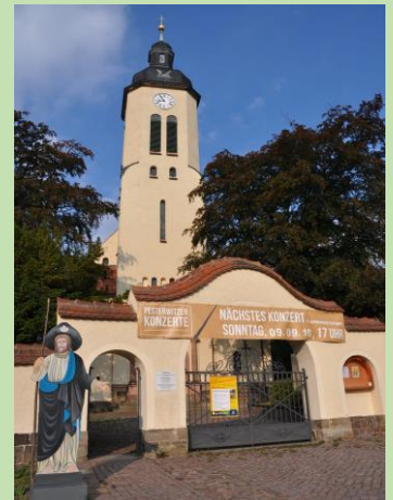
Vor der Kirche ermuntert unser Jakobspilger zum Eintreten.

Alle Gebäude mit Garage und Schuppen, sowie den entsprechenden Pläner-Umfassungsmauern sind umfassend saniert.