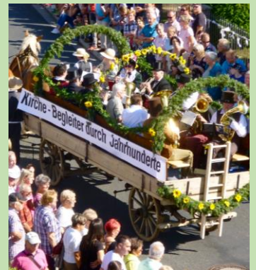
Festumzug 950 Jahre Pesterwitz - die Kirchengemeinde mittendrin.