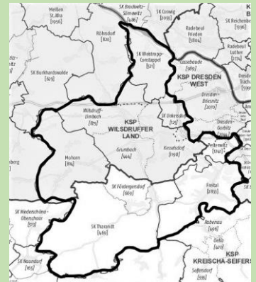
Der neue Kirchgemeindebund

Der Friedhof zählt auf Grund seiner Lage (weite Aussichten in das Osterzgebirge), seiner überschaubaren Größe seiner historischen Grabmale und des Baumbestandes zu den schönsten Dorffriedhöfen um Dresden. Er ist sehr gut ausgelastet und trägt sich wirtschaftlich selbst.