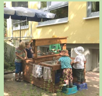
Regelmäßig berichten wir in unserem Gemeindebrief aus unserer Kita „Samenkorn“.

Familienkirche – ein neuer Gottesdienst, den die Gemeinde mit der Gemeindepädagogin selbst gestaltet