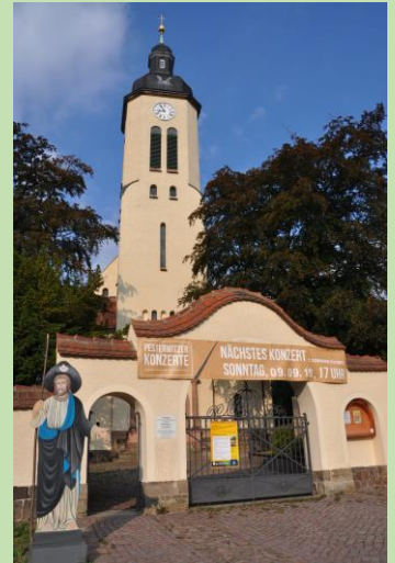
Vor der Kirche ermuntert unser Jakobspilger zum Eintreten.

Alle Gebäude mit Garage und Schuppen, sowie den entsprechenden Pläner-Umfassungsmauern sind umfassend saniert.