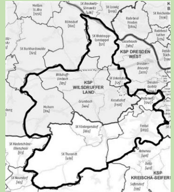
Der neue Kirchgemeindebund

Die Kirchgemeinde Pesterwitz schließt sich ab den 02.01.2021 mit 7 weiteren KG zum Kirchgemeindebund Wilsdruff-Freital zusammen (insgesamt ca. 9200 Gemeindeglieder), in dem es 7,75 Pfarrstellen gibt. Pesterwitz ist nach Freital (2 Pfarrstellen) die zweitstärkste Gemeinde mit 1 Pfarrstelle.